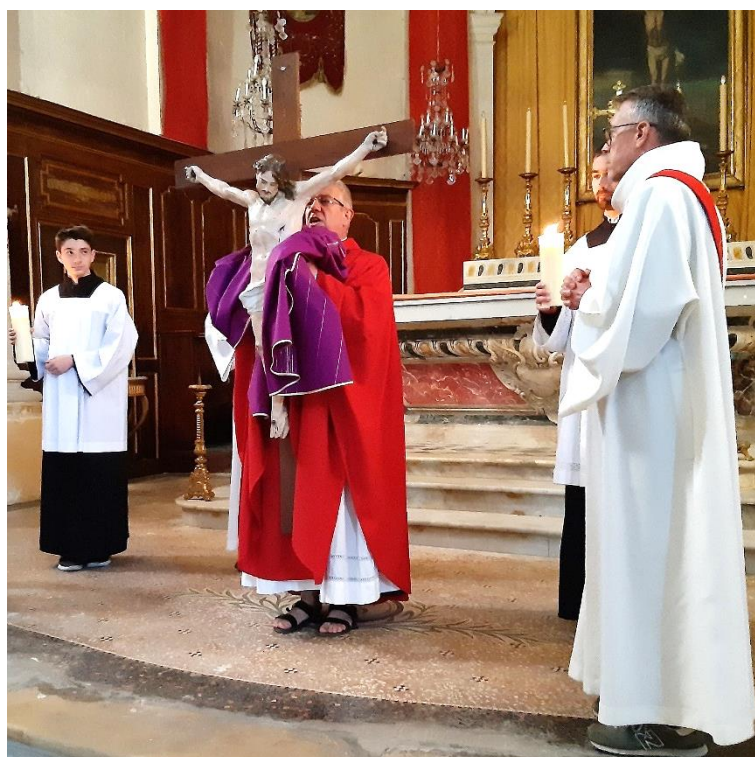
« Voici le bois de la croix, qui a porté le salut du monde. Venez, adorons-le ».

Mon peuple, que t'ai-je fait ? En quoi t'ai-je offensé ? Réponds-moi !