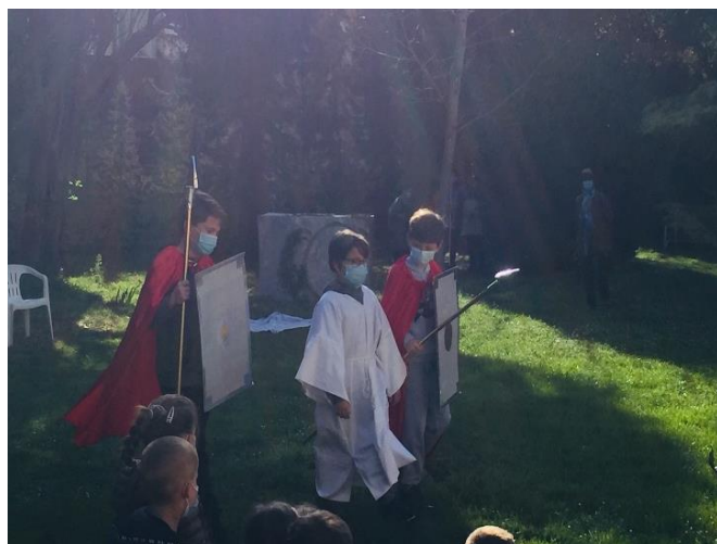
Arrestation de Jésus par les soldats romains

Nous rendons Grâce à Dieu pour cette belle et pieuse journée. (Véronique Grangier)