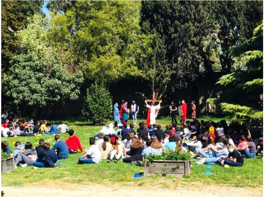
Jésus est crucifié