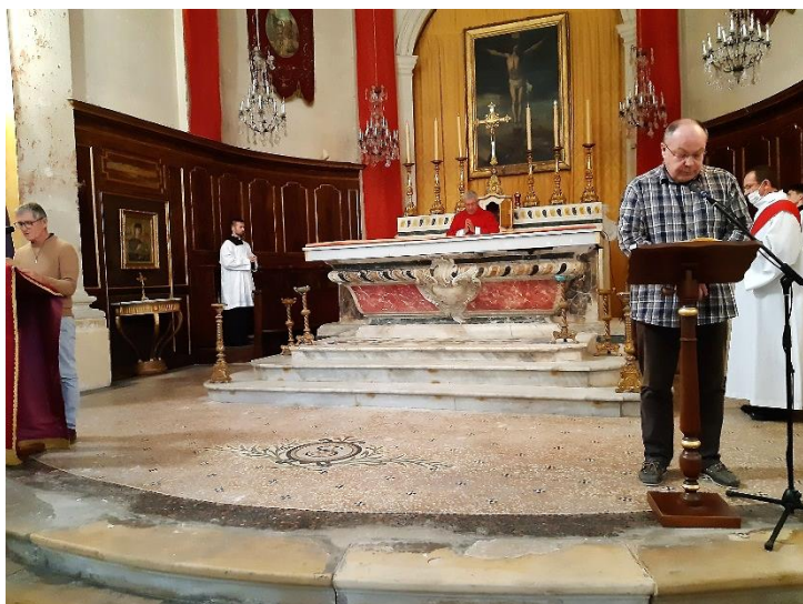
Proclamation de l'Évangile, « la Passion de Jésus Christ selon Saint Jean », dans une église sobre et dépouillée. Toutes les statues sont restées voilées.