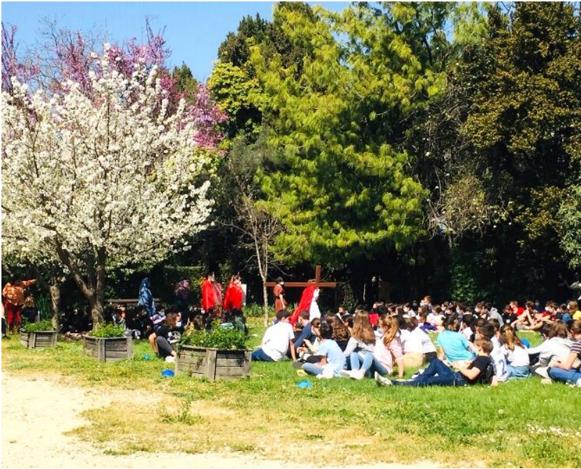
Jésus porte sa croix