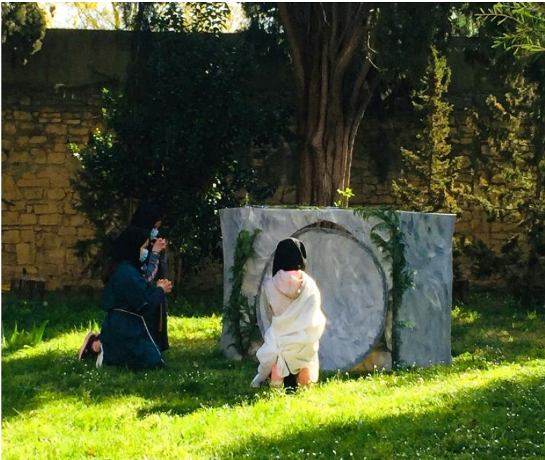
Jésus est mis au tombeau