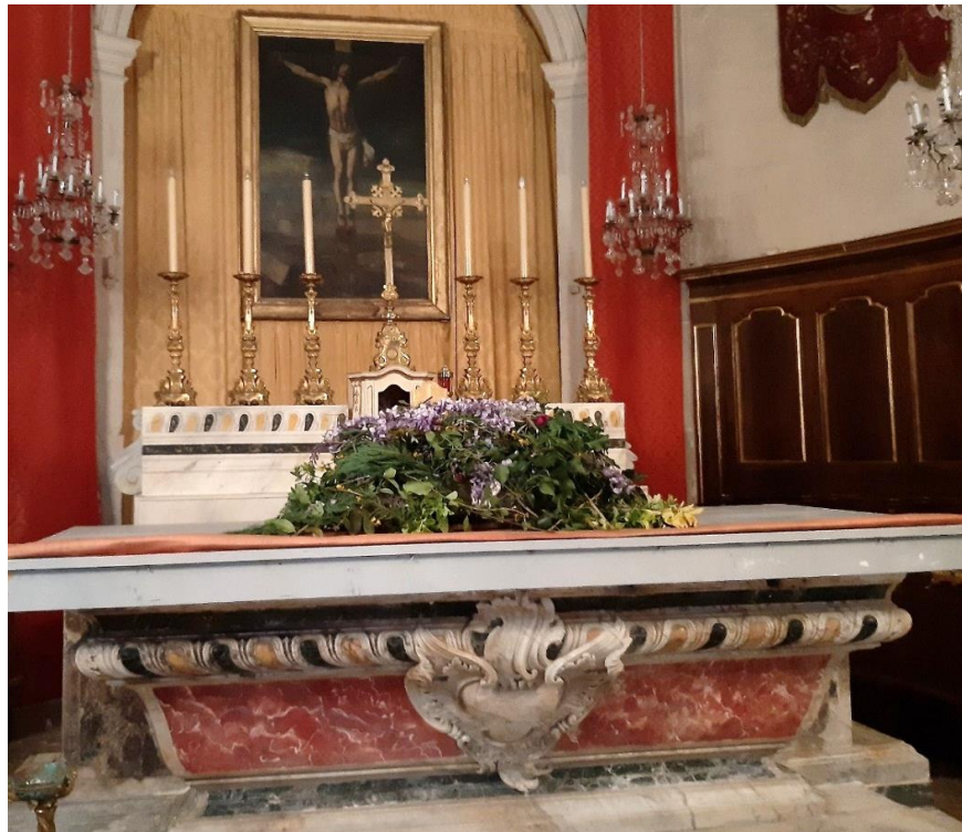
Jésus est au tombeau. Veillons avec Marie, sa mère, et tous ses disciples...