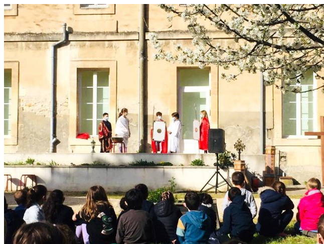
Jésus est jugé par Ponce Pilate